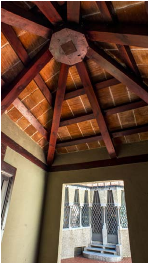
Caseta de nines: Situada al pati de llevant.