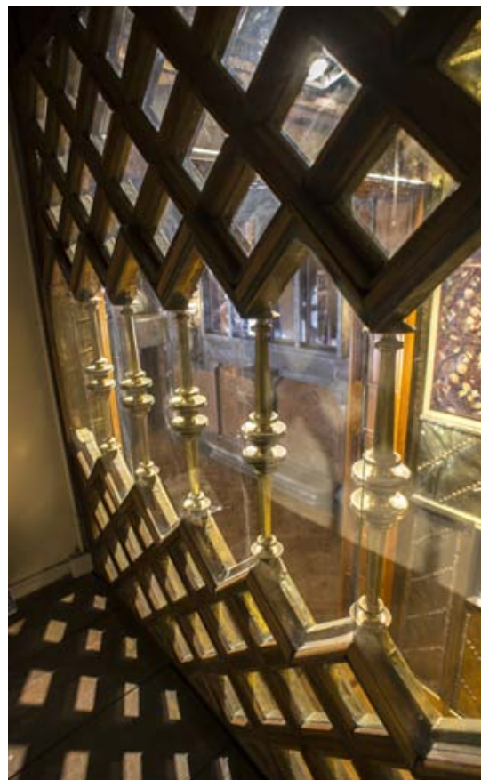
Interior de la llotja de la capella: Destinada al servei.