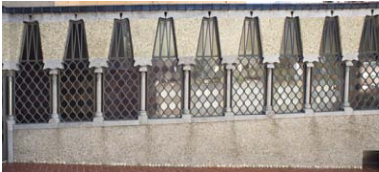
Corredor de Llevant: Que comunica el Palau Güell amb la casa familiar dels Güell, avui, seu del Centro Galego.