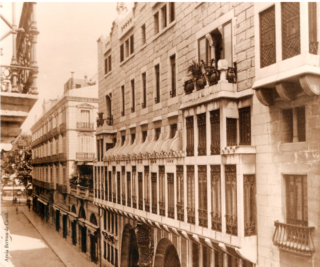
Arxiu Bertran de Caralt.