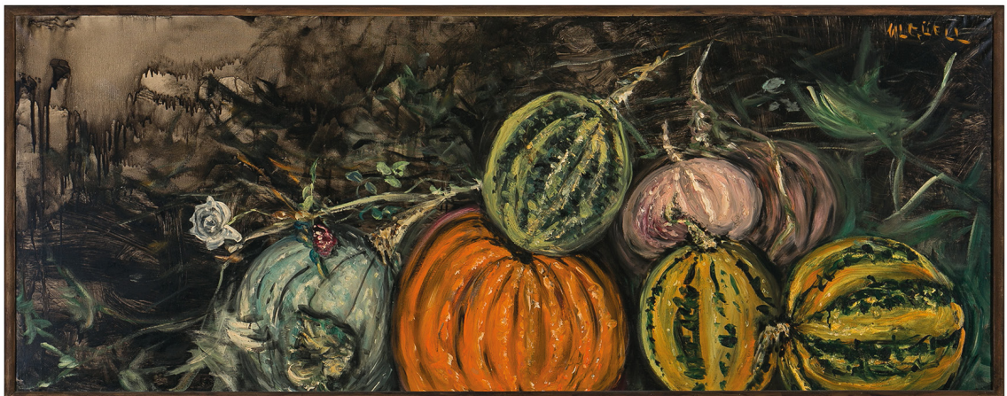
Títol: Carbasses . Datació: ca. 1915. Tècnica: oli sobre tela. Procedència: Borja Olano.

L'exposició inclou dues obres seves, Roses (ca. 1921) i Clavells (abans de 1926), cedides en préstec pel Museu Nacional d'Art de Catalunya que presenten rams de flors sobre fons foscos i poc detallats, de pinzellades gruixudes i expressionistes. Aquestes són les dues primeres obres pintades per una dona que van ser adquirides per l'Ajuntament de Barcelona.