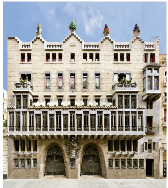
Imatge actual de la façana del Palau Güell.