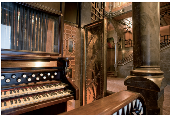
Imatge de la consola original de l'orgue del Palau Güell, dissenyat per Aquilino Amezua.