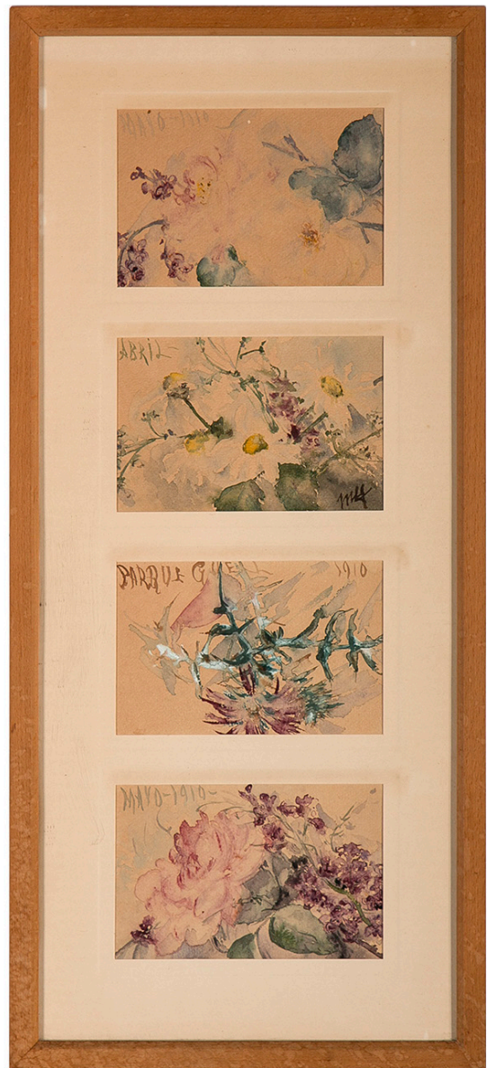
Postals de flors. Datació: ca. 1910. Tècnica: Aquarel·la sobre paper. Procedència: Barons de Saint Martin.

La majoria de les seves realitzacions en aquarel·la són postals de viatges, records o decoracions en diferents objectes, com ventalls, tauletes o tulipes de làmpades, il·lustracions de llibres, revistes o programes d'actes.